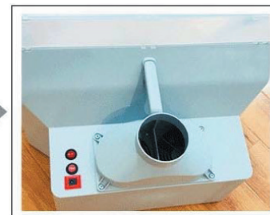
HS-E550BLK és E550LK

A levegőkimenet a doboz hátulján található.