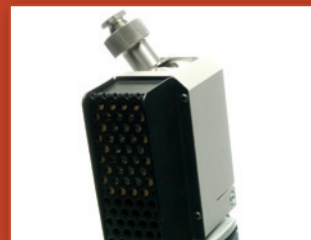
Beépített porelszívás, cserélhető porszűrő betéttel