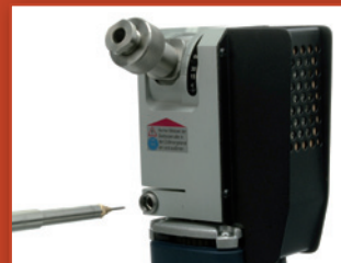
Precíz beállítás a befogó segítségével