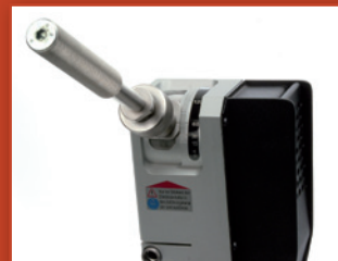
Köszörülési szög beállítás 15°-180°