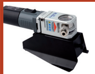
Stabil rögzítés a munkasztalhoz.

IWELD Kft. 2314 Halásztelek II. Rákóczi Ferenc út 90/B www.iweld.hu